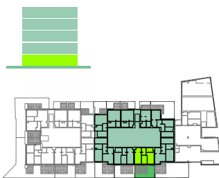
B0.07 (G) ogród pow. 41,15 m2